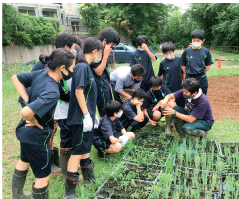
農作業について専門的なレクチャーを受けます。作業の一つ一つが、農作物を育てる上で大切な工程です。

本学苑の敷地内には、学苑農場「アグリラボ」があります。ここでは、自分たちで土を耕し、作物を栽培します。苗木の支柱立てや雑草取りなど野菜が育つまでこまめな世話が必要ですが、作物を収穫する喜びや達成感は大きく、野菜作りのすべてが豊かな感性の育成に結びつきます。「アグリラボ」は、自然を学び、自己を発見し、自然と人間の関係を学び、生き方を学ぶための最も基盤となる体験的な学習の場として、創立当初より大切にしています。