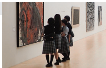
高校デザイン美術コースと合同で行った美術館見学